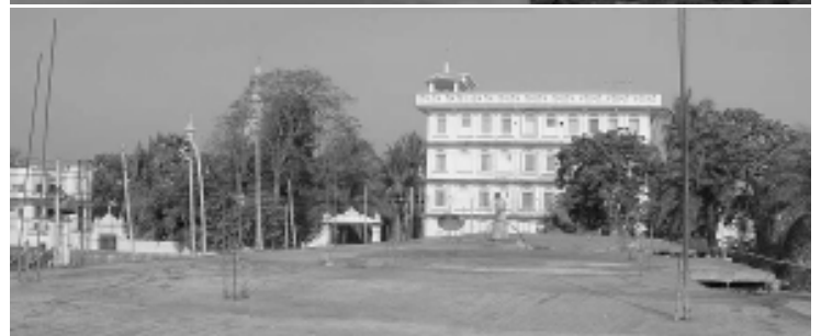
Строительство Шри Севашрама на берегу Шри Говинда Кунды в Шри Чайтанья Сарасват Матхе, Навадвипа.