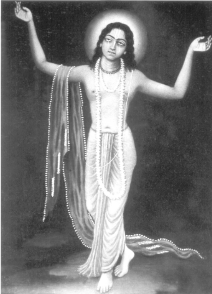
Господь Шри Кришна Чайтанья Махапрабху

Стихи из Шри Чайтанья-чаритамриты (Ади-лила, 13. 89-124), которые поют на Шри Гаура-Пурниму (стр. 2-3)